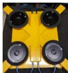
Multi adapter 30x30 - 50x50