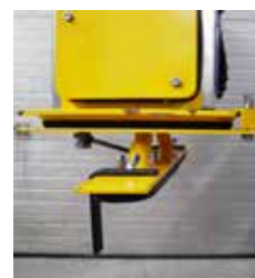
Sugefod for kantsten

Som tilbehør til Vakuumløfter er der forskellige sugefødder med adaptorplader, der passer til opgaven.